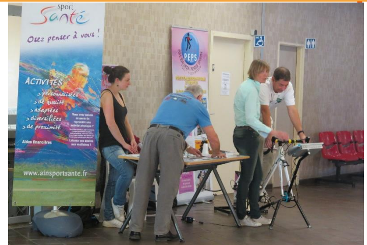
Centre Hospitalier de Bourg-en-Bresse

Et pourquoi pas : le circuit des plaintes et réclamations, la bientraitance etc.