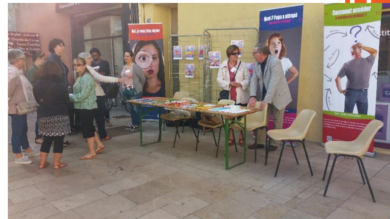
Le marché de Montélimar