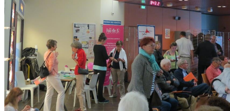
Centre Hospitalier de Bourg-en-Bresse